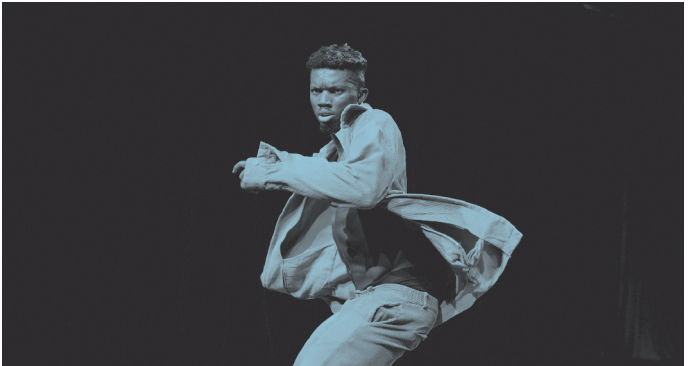
BLACK, d'Oulouy.